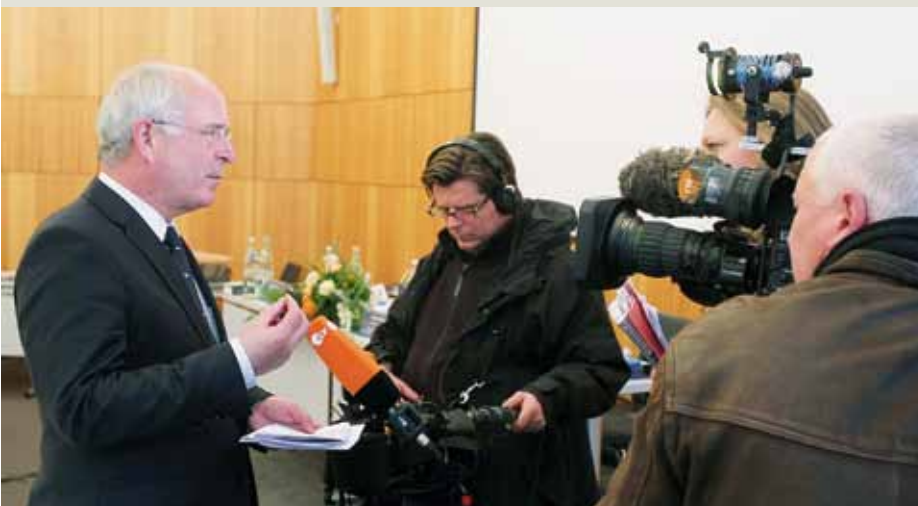
Das ZDF interviewt Landesbischof Weber zur Arbeit der Härtefallkommission.

Eine neue gesetzliche Bleiberechtsregelung solle fünf Standards enthalten: Verzicht auf eine Stichtagsregelung und stattdessen Orientierung an einer Mindestaufenthaltsdauer, Senkung der Anforderungen an die Lebensunterhaltssicherung, kein Ausschluss von alten, kranken und behinderten Menschen vom Bleiberecht, Verzicht auf restriktive Ausschlussgründe sowie keine Familientrennung.