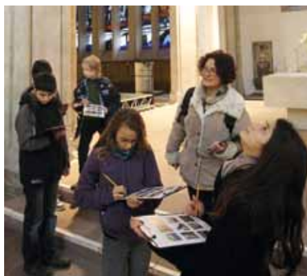
Kirchenerkundung in St. Magni.

Orgelmaus“ für Kinder, Mitteilungen für die Kirchengemeinden, das Internet und die Presse – und immer wieder Mundpropaganda. Inzwischen reiche die Vernetzung bis hin zu Einrichtungen der Universität und der Hochschule für Bildende Künste in Braunschweig.