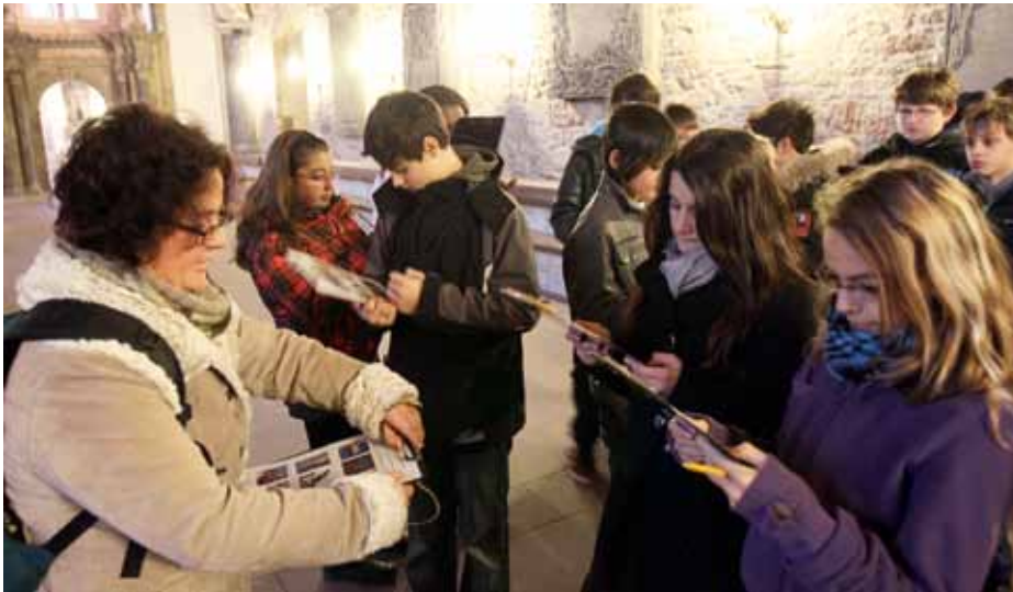
In der Magnikirche: Mit der richtigen Anleitung werden Kirchenräume zu einer besonderen religiösen Erfahrung.

Der umfangreiche Lehrplan reichte von der Kirchengeschichte bis zur Öffentlichkeitsarbeit. Am Ende gab es ein Zertifikat, für das zuvor das schriftliche Erarbeiten und praktische Umsetzen einer eigenen Kirchenerkundung Voraussetzung war.