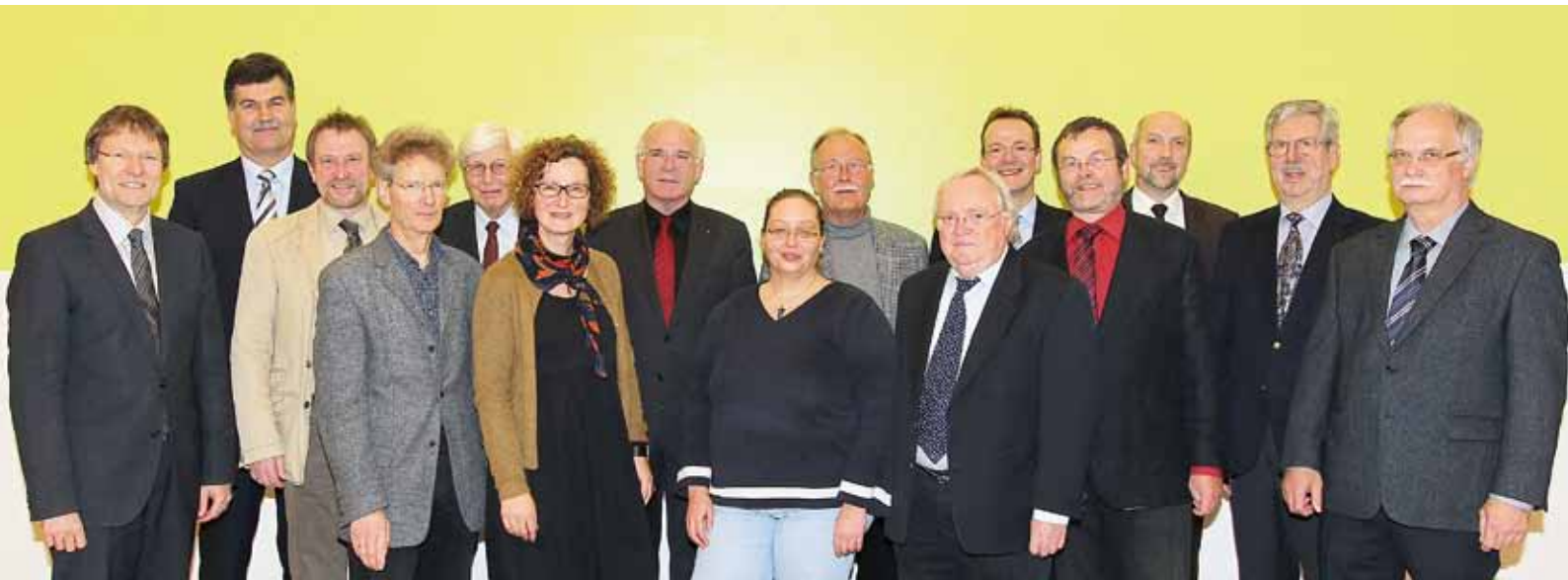
Der Konvent der Abt Jerusalem-Akademie und die Vorsitzenden der Arbeitskreise.