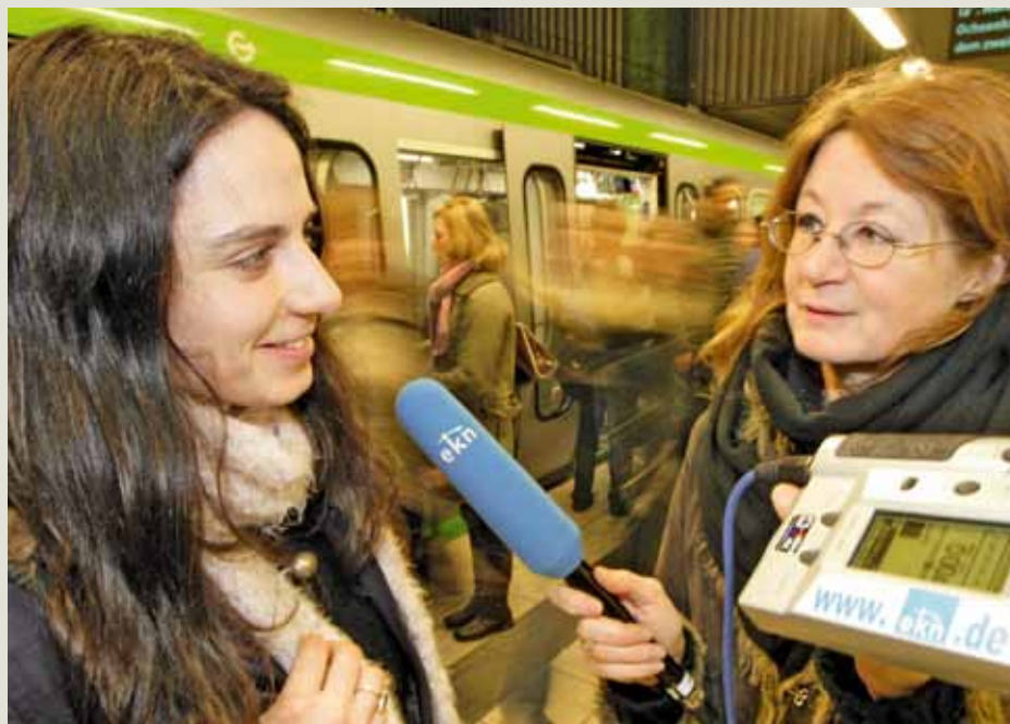
Auch der Kirchenfunk gehört zu den Aufgaben der Konföderation.

Zur Strukturreform sagte Weber, es sei sowohl nach innen als auch nach außen besser, einen gemeinsamen Beratungsprozess zu führen als nur abzuwarten. Die konföderierte Synode beschloss einstimmig, den Synoden von Braunschweig, Hannover, Oldenburg, Schaumburg-Lippe sowie der Evangelisch-reformierten Kirche mit Sitz in Leer den Beratungsprozess zu empfehlen. Wenn diese zustimmen, soll ein Ausschuss gebildet werden, für den jede Kirche drei