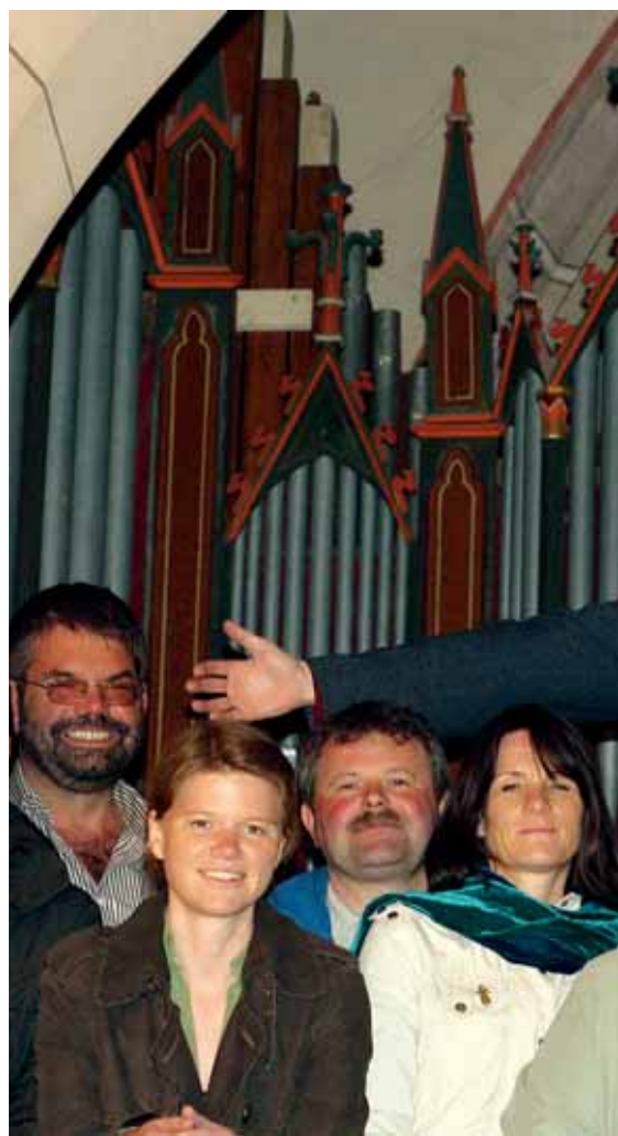
Zusammenarbeit kann gelingen – und sogar Freude