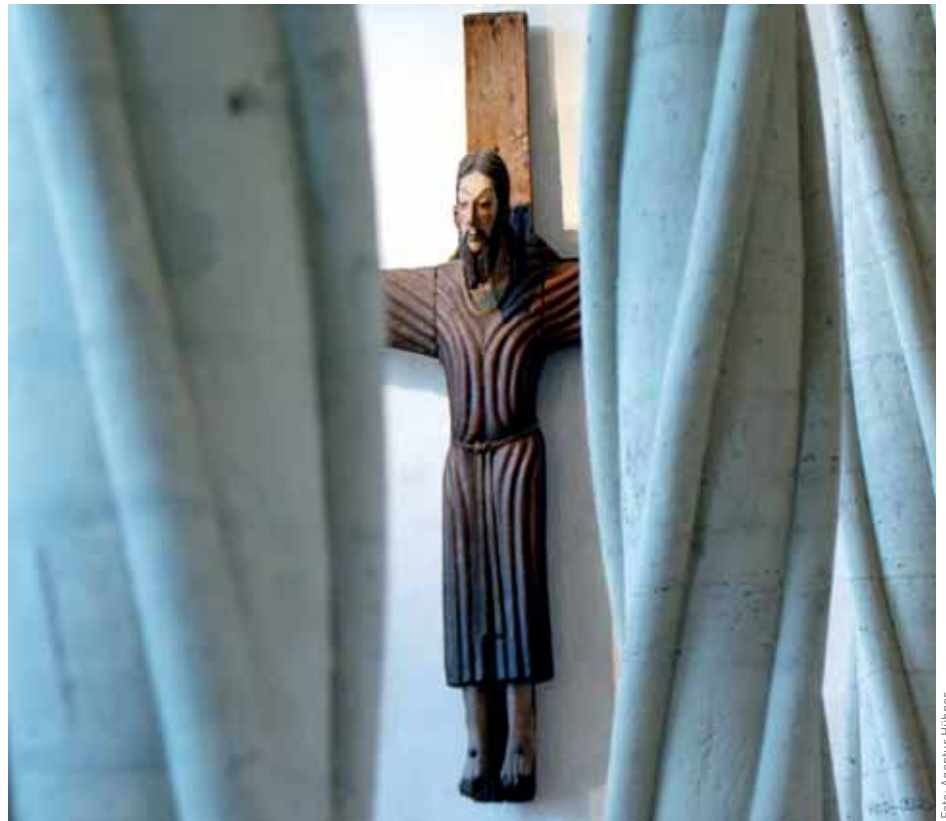
Das Imervard-Kreuz im Braunschweiger Dom, Erkennungszeichen der Landeskirche Braunschweig.

Die Leitung der evangelischen Kirche erfolgt demnach nicht streng hierarchisch, sondern durch einen ausgeklügelten Prozess der Beteiligung und Mitwirkung. Insbesondere auch der „Nichtordinierten“, also derjenigen, die keine Pfarrer sind. Das wird bereits an den Zahlen deutlich: In der Landeskirche Braunschweig sind rund 300 Pfarrerinnen und Pfarrer tätig, aber fast 3000 Kirchenvorsteherinnen und Kirchenvorsteher – Menschen, die sich in ihrer Freizeit ehrenamtlich für die Kirche engagieren. Und auch die Synoden bestehen zu rund zwei Dritteln ihrer Mitglieder aus Ehrenamtlichen.