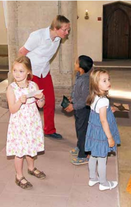
Neugierig und voller Fragen erkunden die Kinder die Kirche.