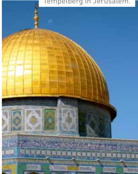
Die goldene Kuppel des Felsendoms auf dem Tempelberg in Jerusalem.

Diese handgreifliche historische Gegenwart und religiöse Prägekraft ist für pragmatische Westeuropäer, die in religionsneutralen Staaten und einer weitgehend säkularen Gesellschaft leben, verstörend. Sie müssen feststellen, dass ihre Maßstäbe der politischen Analyse dem Heiligen Land kaum gerecht werden. Warum, so