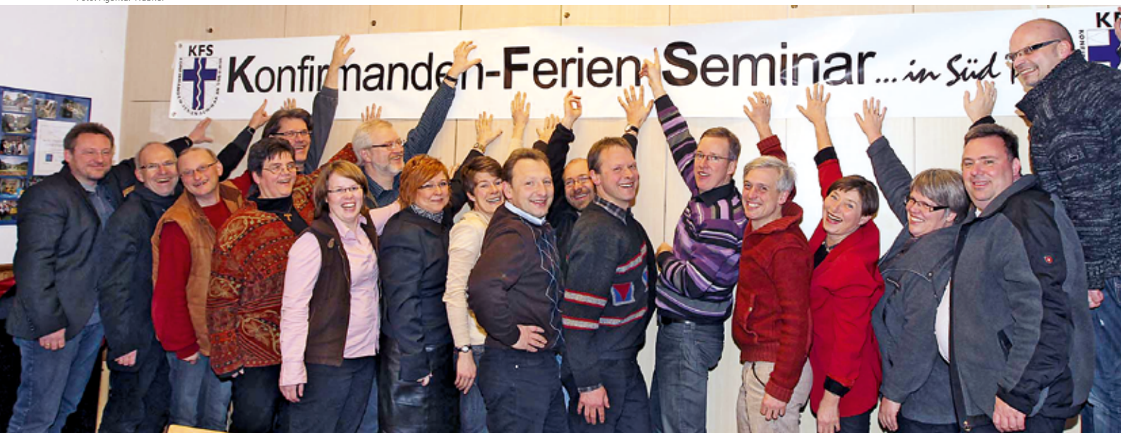
Miteinander bereiten die Gemeinden das Konfirmandenferienseminar vor.

An dem obligatorischen Gruppenfoto mit Pfarrer kommt niemand vorbei: Feierlich und chic zurecht gemacht strahlen die Konfirmanden in die Kamera. Einige der zumeist 14-Jährigen wirken ein wenig unsicher, doch die meisten genießen den Augenblick. Nun haben sie den Schritt ins kirchliche Erwachsenenleben vollzogen. Mit ihrer persönlichen Bestätigung der Taufe und ihrem bewussten Ja zum christlichen Glauben dürfen die „Konfis“ fortan zum Beispiel am Abendmahl teilnehmen und Taufpate werden.