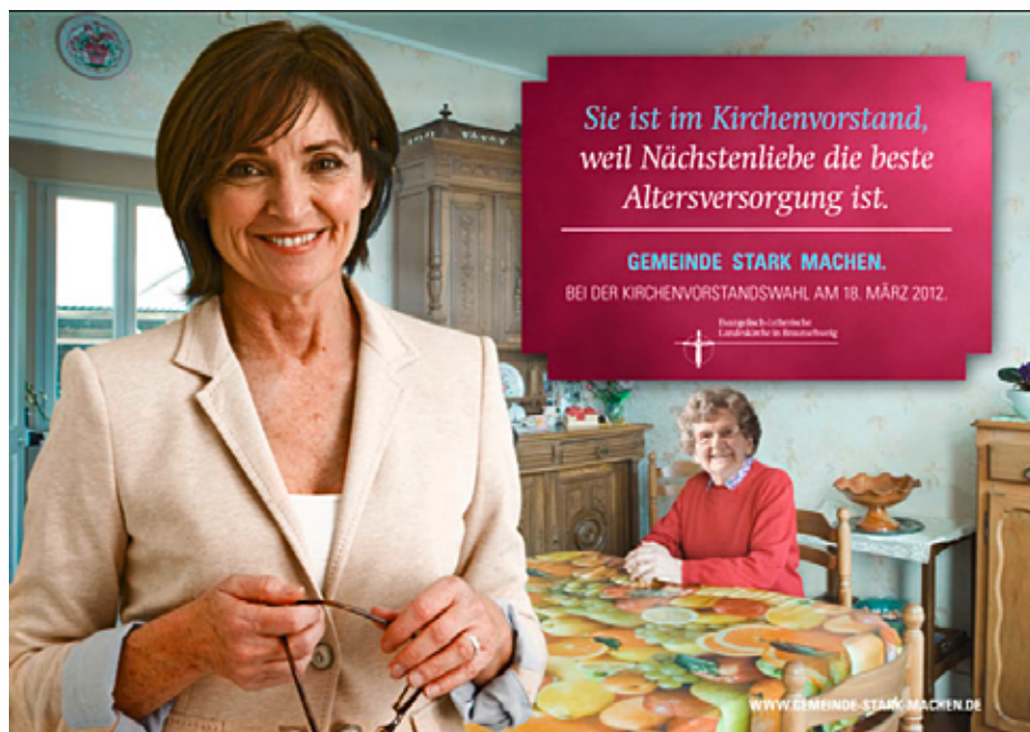
Entwurf für die neue PR-Kampagne: So ähnlich werden künftige Plakate aussehen.

Am 18. März 2012 werden in der Landeskirche Braunschweig wieder die Kirchenvorstände gewählt. Die ersten Vorbereitungen dafür sind angelaufen. Die Rahmenbedingungen einer PR-Kampagne stehen fest, und auch die rechtlichen Grundlagen sind bereits klar. Was die Wahlbeteiligung angeht, war Braunschweig beim letzten Mal Spitze in Niedersachsen.