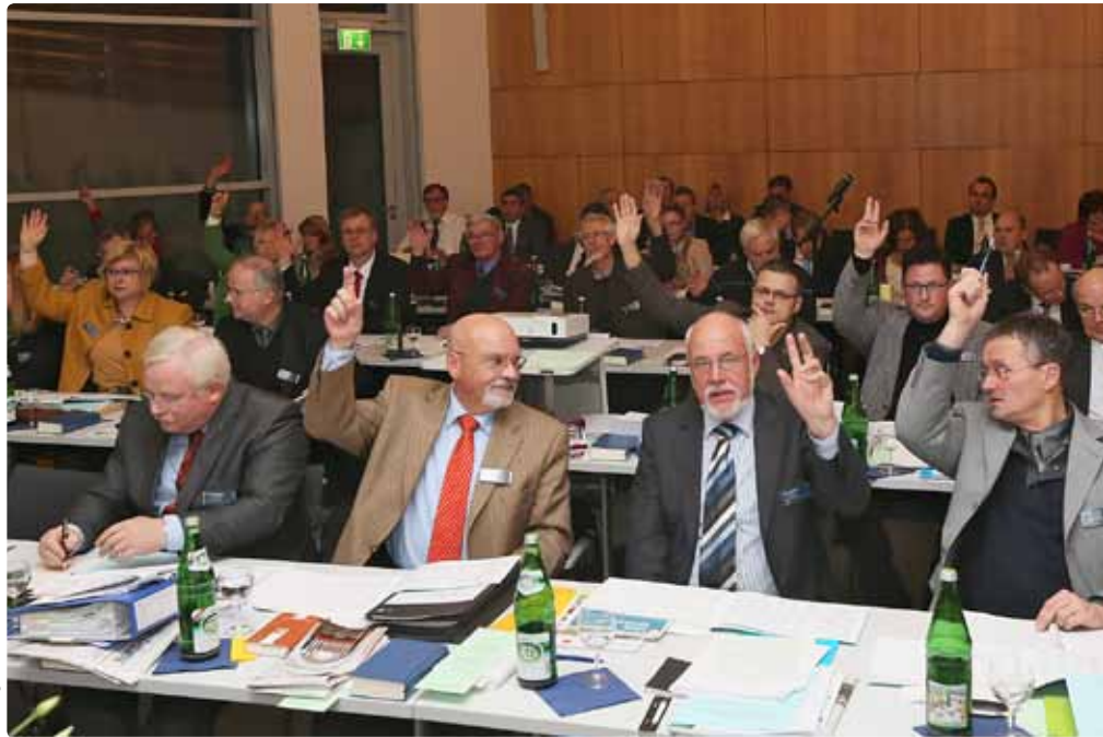
Protestantischer Parlamentarismus im Tagungszentrum Haus Hessenkopf.

In Paragraph 13 des beschlossenen Ergänzungsgesetzes heißt es,