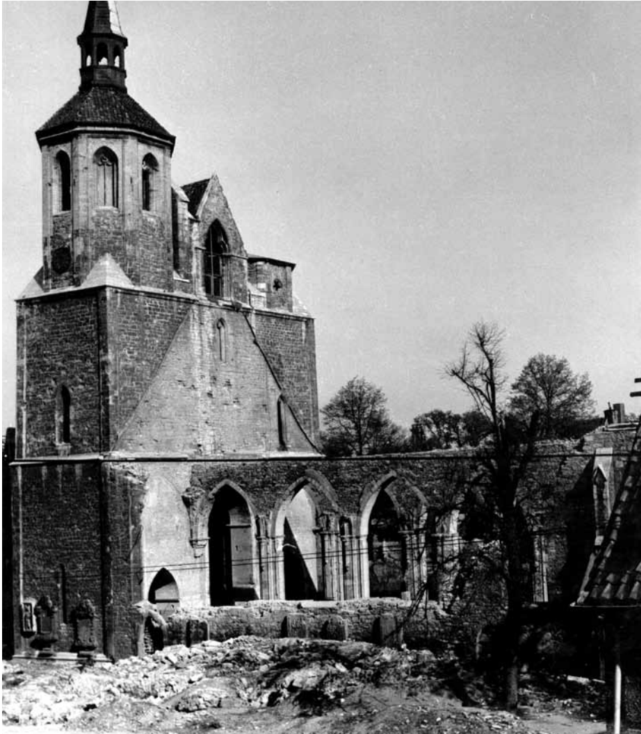
Im Krieg massiv zerstört: die St. Magni-Kirche in Braunschweig.