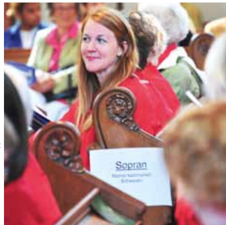
Letztes Jahr in Braunschweig: der Malmö Kammarkör.