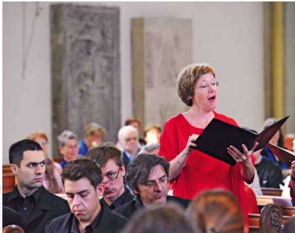
Internationale Spitzenklasse: Beim Chorfest „Canta Sacra“ brillieren Sängerinnen und Sänger aus ganz Europa.

Repertoire der europäischen Gäste mit den Zuschauern und den heimischen Chören bei einem Fest kräftig gefeiert werden soll. „Dabei wird